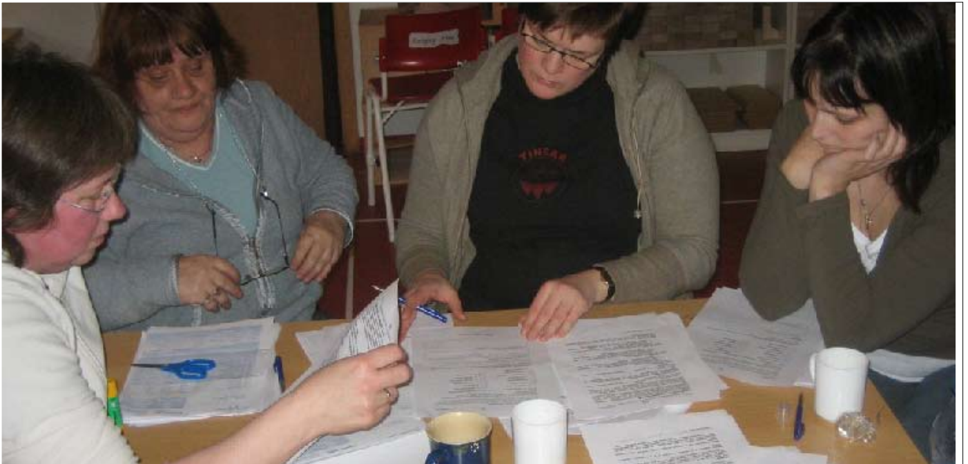
Starfsmenn leikskóla og grunnskólanna á AFLs svæðinu voru dugleg við að senda inn endurmatsbeiðnir vegna starfa sinna enda störf við umönnun og uppeldi lágt metin og sérstaklega þeirra sem kölluð eru "ófaglærð". Drátt fyrir talsverðan fjölda endurmatsbeiðna hlutu aðeins nokkrar samþykki endurmatsfndar SGS og LN og engin þeirra sem útbúið var þetta föstudagskvöld á leikskólanum á Seyðisfirði.

Fleira ekki gert og fundi slitið kl 19:20 og haldið í kvöldverð. (Brot úr fundargerð)