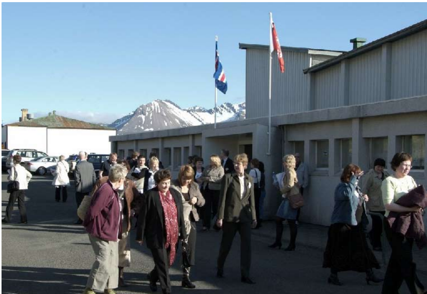
Fáskrúðsfjörður skartaði sínu fegursta er fundargestir gengu yfir á hótél til að njóta veitinga.