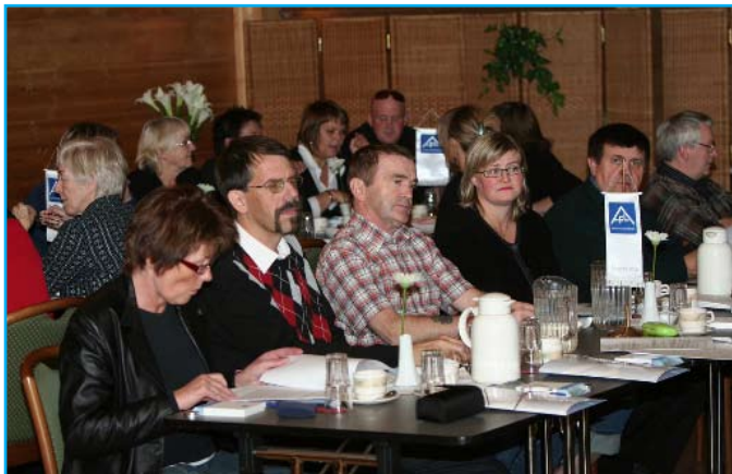
Starfsfólk félagsins hefur unnið mikið starf til að ná félagslegri sameiningu. Félagið stóð fyrir myndarlegri kjaramálaráðstefnu á Djúpvögi í sept.