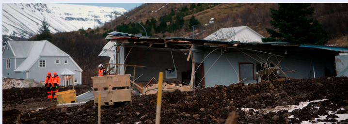
Leifur Silfurballarinnar standa hér upp úr skriðunni.

Meðal aðgerða sem félagið greip til í upphafi Covid faraldursins var að fjölga fartölvum og þar sem þurfti að endurnýja borðtölvur voru fartölvur keyptar í staðinn. Það hefur komið sér vel í ófærð síðustu daga.