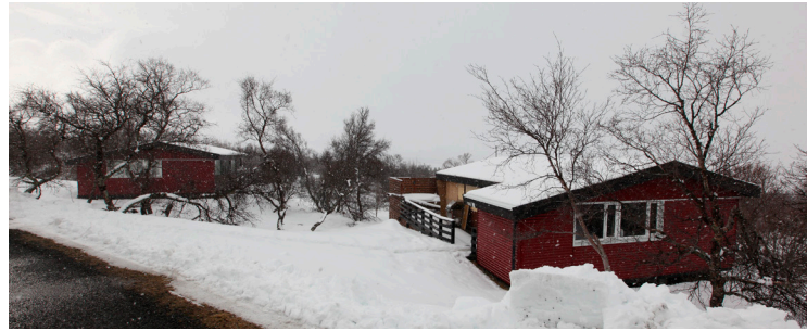
Prettán hús eru í boði á Einarstöðum um páskana. Þar verða þó þrjú hús í framkvæmdum.

Þó svo að allt útlit sé fyrir að ný hús félagsins í Grímsnesi verði komin í notkun er ekki opið fyrir umsóknir í þau, enda ekki ennþá