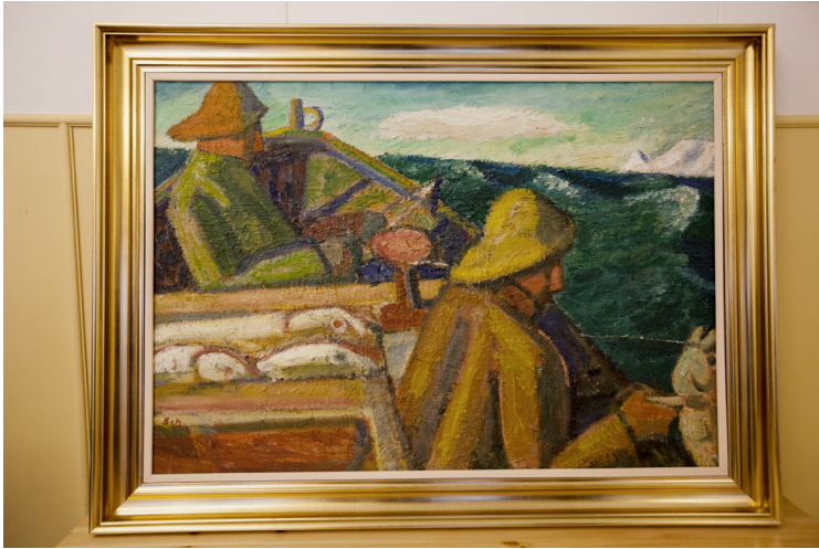
Málverkið Sjómenn eftir Gunnlaug Scheving sem krakkarnir unnu eftir.