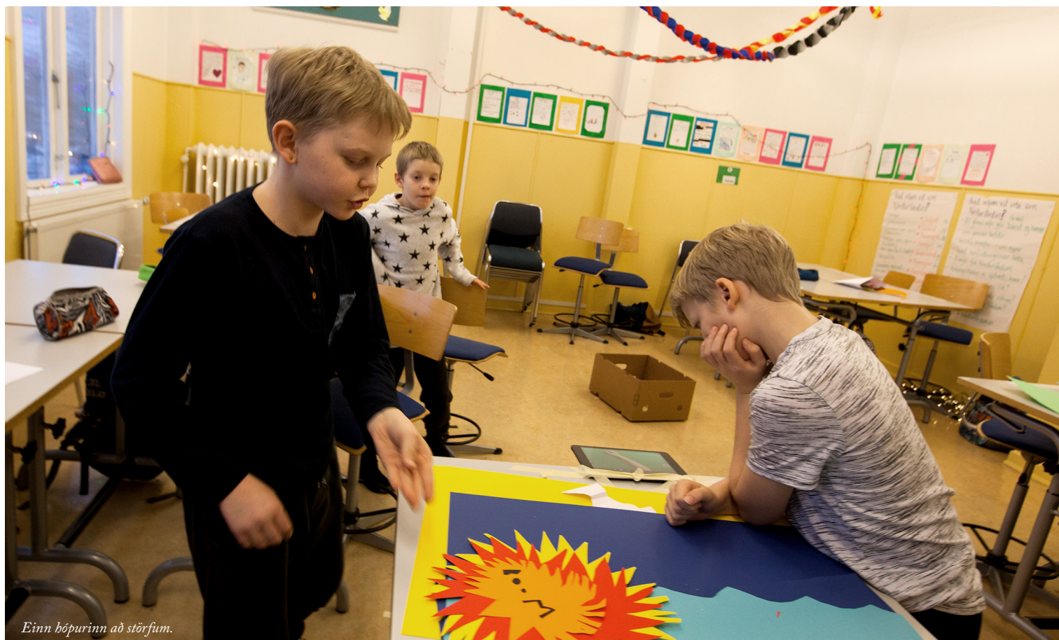
Einn hópurinn að störfum.

Heimsókn frá Listasafni ASÍ í Seyðisfjarðarskóla