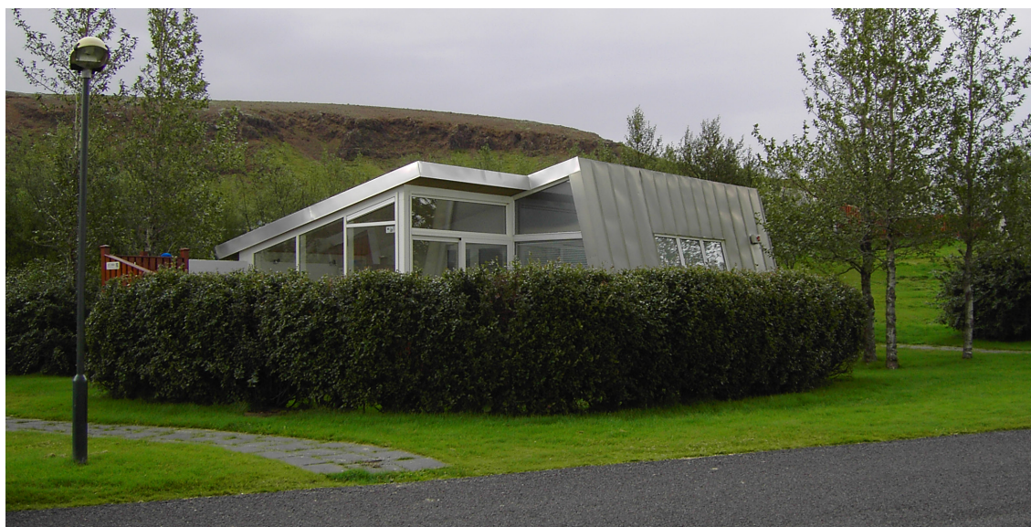
Orlofshús í Ölfusborgum séð utan frá.

AFL Starfsgreinafélag hefur fest kaup á tveim húsum í Ölfusborgum, húsum nr. 14 og 15. Þau koma til notkunar fyrir félagsmenn frá og með 1. mars 2018 á sama hátt og hús félagsins á Einarstöðum, Illugastöðum og í Klifabotni, þ.e.a.s. almenn leiga. Sótt er um á vef félagsins undir „Bóka orlofseign,“ fyrir utan úthlutunartímabil sem er um páska frá 28. mars til 4. apríl og sumarmánuðina frá 1. júní til 24. ágúst. Þá þarf að sækja um fyrir auglýsta tíma á þar til gerðu umsóknareyðublaði. Hægt er að sækja um Ölfusborgir fyrir þessa páska, með símtali á skrifstofu félagsins eða á eyðublaði á www.asa.is .