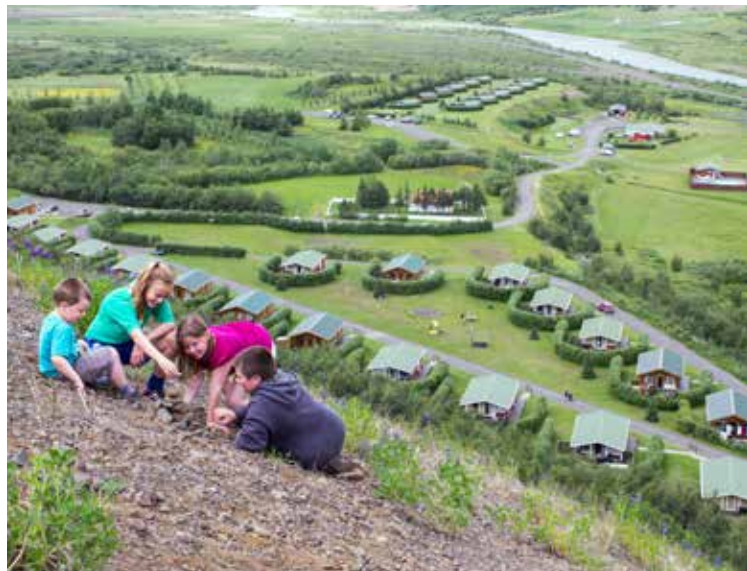
Leikur í fjallaferð. Myndin er tekin af Sigurbirni Árnasyni ofan við Illugastaði sumarið 2015.

Á síðunni má sjá nokkrar af verðlaunamyndum liðinna ára.