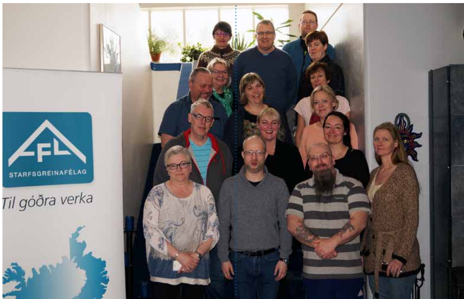
Trúnaðarmenn að loknu námskeiði í Staðarborg í Breiðdal.