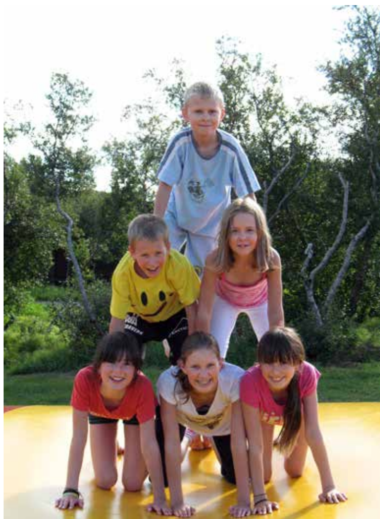
Fjör á Einarstöðum sumarið 2015.