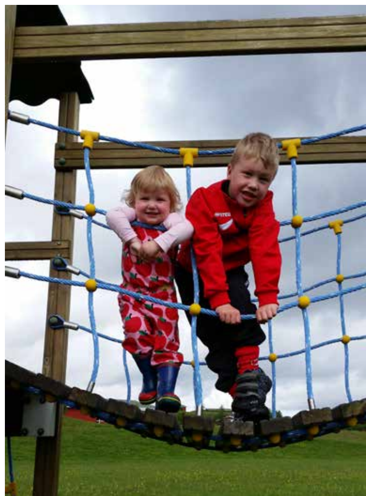
Gaman á leikvellinum. Sigurmyndin 2014 eftir Karen Sif Randversdóttir. Myndin er tekin á Illugastöðum.