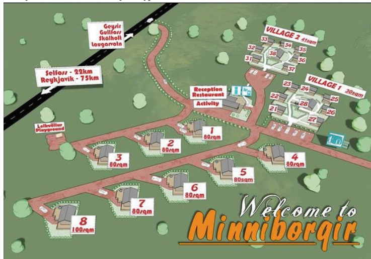
Skipulag sumarhúsabyggðarinnar Minniborgar.