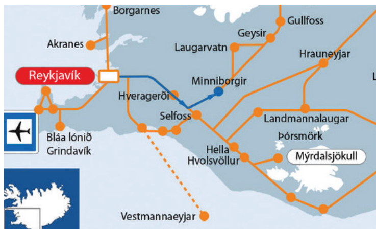
Leiðin í Minniborgir