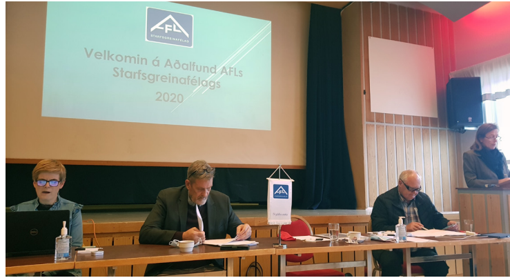
Frá aðalfundi AFLs í haust.

Á meðan upphafsáhrifin voru að koma í ljós leiðbeindi félagið hundruðum félagsmanna, aðallega erlendum, og aðstoðaði í tengslum við minnkað starfshlutfall og uppsagnir. Með sumrinu fóru