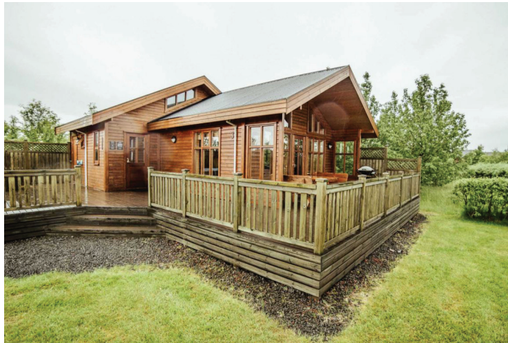
Eitt af húsunum sem AFL hefur keypt.

Minniborgir eru í 75 km fjarlægð frá Reykjavík, 24 km frá Selfossi, 40 km frá Geysi og 50 km frá Gullfossi. Ekið er upp Biskupstungnabraut (þjóðveg 35) skammt vestan Selfoss, um 20 km eftir þeim vegi og eru bústaðirnir á hægri hönd rétt við þjóðveginn – rétt norðan við Borg í