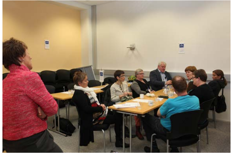
Vinnuhópur að störfum á trúnaðarmannanámsskeiði.

Alls eru tæplega 80 trúnaðarmenn félagsins starfandi á vinnustöðum á félagssvæðinu og mættu þeir vera fleiri því allt of margir vinnustaðir eru án trúnaðarmanna. Skýringin er að hluta hversu margir vinnustaðir eru fámennir – en rétt til að kjósa trúnaðarmann öðlast launafólk ekki fyrir en 5 starfsmenn eða fleiri eru á vinnustaðnum.