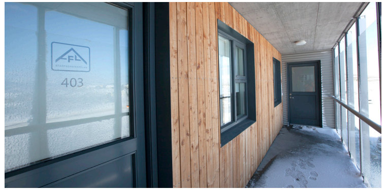
Íbúðir AFLs í Ásatúni á Akureyri.

99% félagsmanna AFLs kynna sér skilmála og fara að öllum reglum. Öll fyrirhöfn er vegna fárra einstaklinga sem ekki virðast geta lesið leigusamning og farið eftir skilmálum. Aðeins örfá útköll á ári eru vegna bilana eða af ástæðum sem telja má réttlætanager.