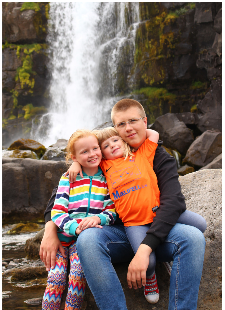
Sigurmynd úr sumarmyndasamkeppni AFLs árið 2015.

Það er þó rétt að taka fram að á þessum 10 árum hafa nokkrar mjög góðar myndir borist og ber að þakka það.