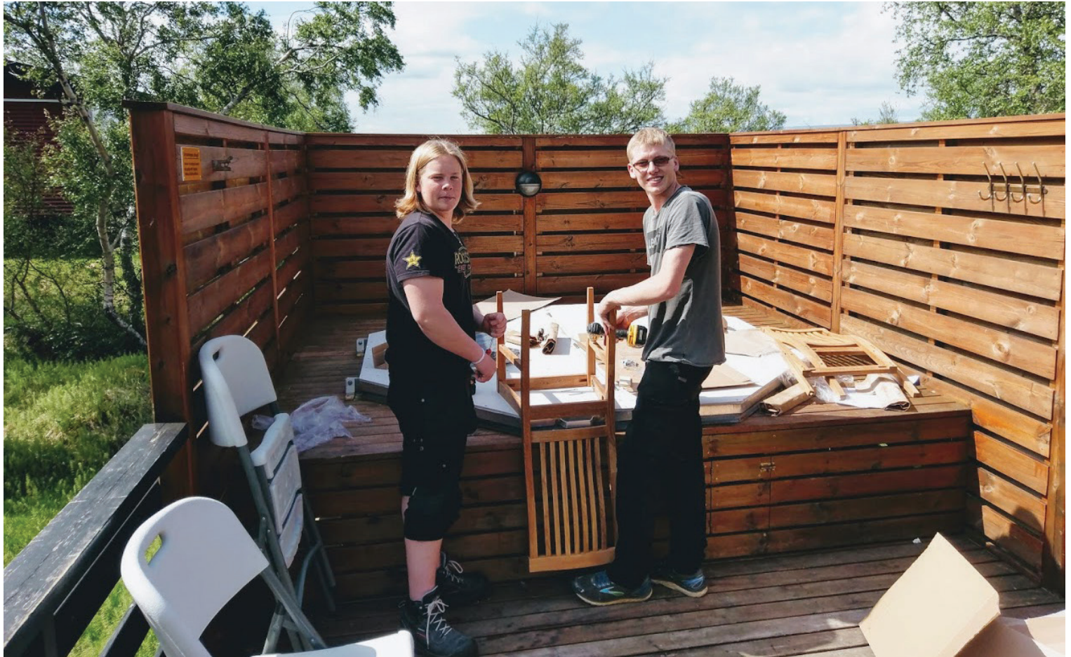
Tveir nýir félagsmenn, starfsmenn Einis hf., setja saman ný húsgögn í endurbettu húsin