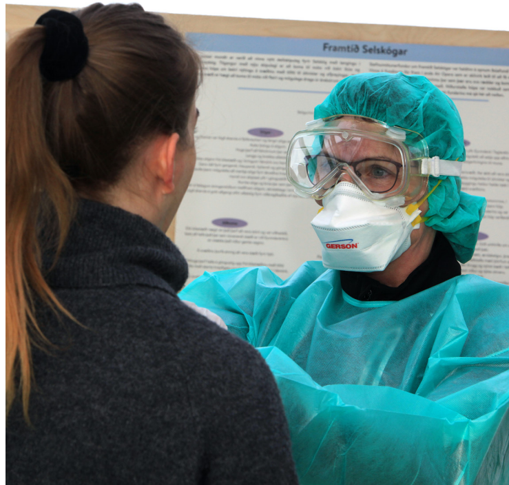
Opinber heilbrigðisþjónusta hefur sannað sig í faraldrinum.

En þegar einn er lokaður inni lokast annar úti. Meðal þeirra voru