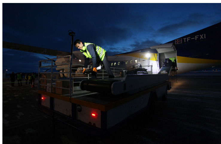
Ekki er tryggt að strax aftur verði þrjár ferðir í bði á dag milli Egilsstaða og Reykjavíkur.

Hér á landi er nú verið að setja af stað átak til auka framleiðslu í landbúnaði og þá sérstaklega framleiðslu á grænmeti. Því er viðbúið að innlend framleiðsla eflist á þessu ári en spurning er hvernig mönnum mun takast að viðhalda stöðu sinni.