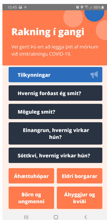
Hve mikla gagnasöfnun mun fólk setta sig við í þágu almannaheilla?

Það sem Darwin meinti þegar hann sagði að þeir hæfustu lifðu af var að það væru þeir sem best aðlagust breytingum. Nú reynir á mannkynið að nýta þessa krísu til góðra verka og aðlagast nýjum veruleika. Þessi veira verður ekki sú síðasta sem hrellir okkur.