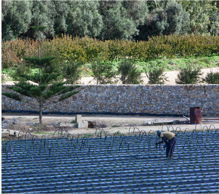
Evrópskir grænmetisbændur hafa verið í vandræðum með vinnuafli út af lokunum landamæra.

evrópskum persónuverndarlögum. Meðal þess sem Singapúrur beittu til að stöðva faraldurinn þar í byrjun var smitrakning í gegnum eftirlitsmyndavélar og andlitsgreiningartækni. Gagnasöfnun yfirvalda um einstaklinga gæti snaraukist í faraldrinum og orðið varanleg og mögulega mun fólk setta sig við einhverja miðlæga gagnasöfnun í framtíðinni – með vísan til „almannaheilla“.