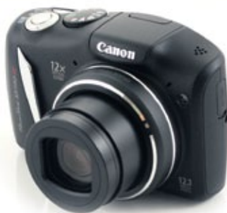
1. verðlaun: Canon Powershot SX130 myndavél