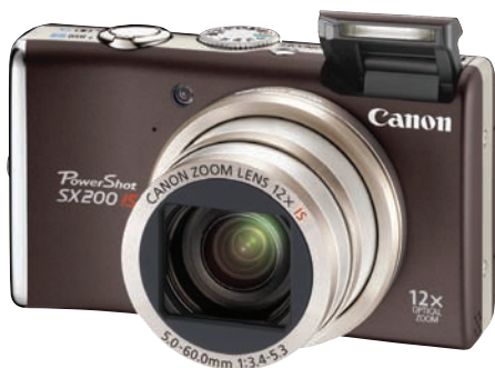
1. verðlaun: Canon PowerShot SX200 myndavél