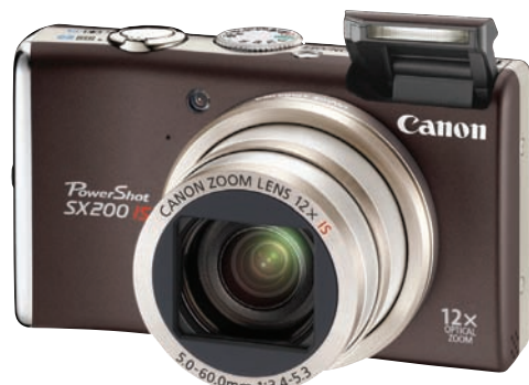
1. verðlaun: Canon PowerShot SX200 myndavél